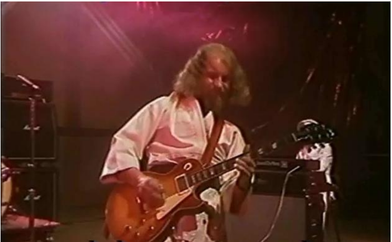
Fota z TV speciálu „Too old...“ z roku 1976